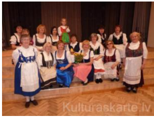
Ventspils vācu kultūras biedrība